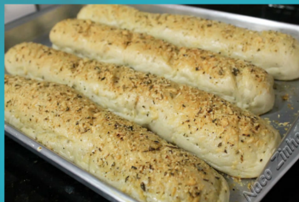
Baguete 3 queijos