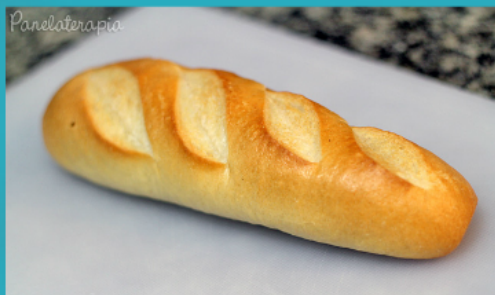
Baguete de sal